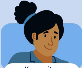
Komunitas Belajar Daerah

Berkoordinasi melalui pegawai dinas yang ditunjuk