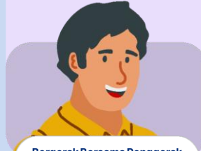
Bergerak Bersama Penggerak Komunitas Belajar (BERGEMA) Guru & KS